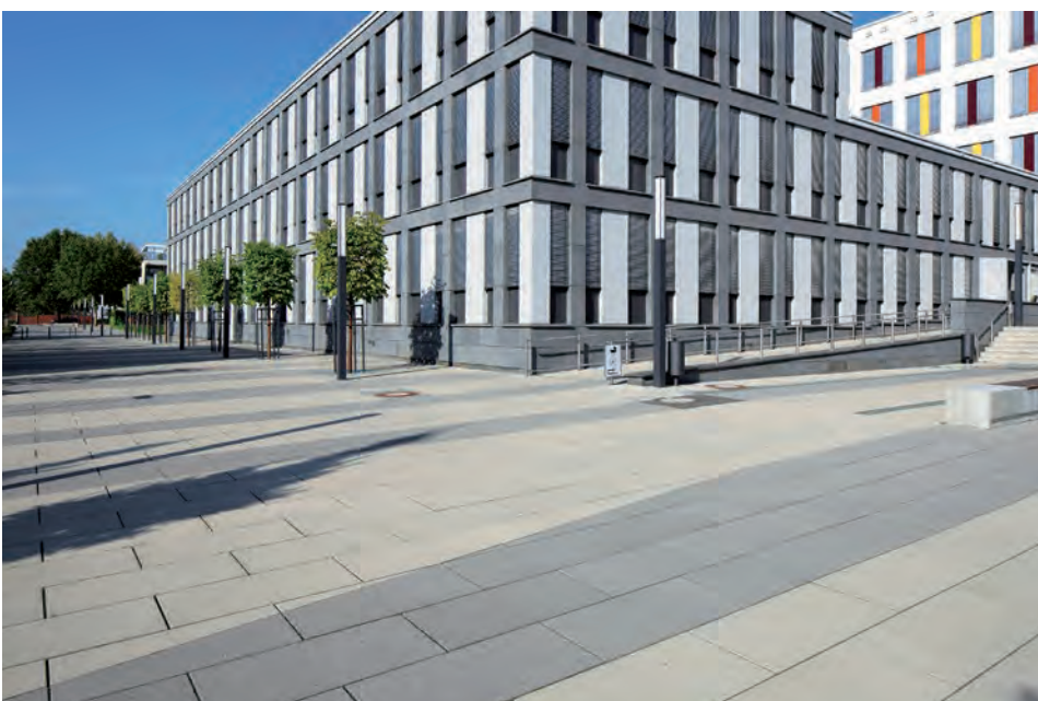
← Justiz- und Verwaltungszentrum, Wiesbaden, KSP Jürgen Engel Architekten GmbH